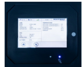
Coordenadas GPS y conectividad GSM