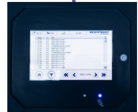
Registros de alarmas remotas