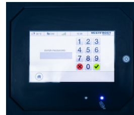
Acceso con contraseña